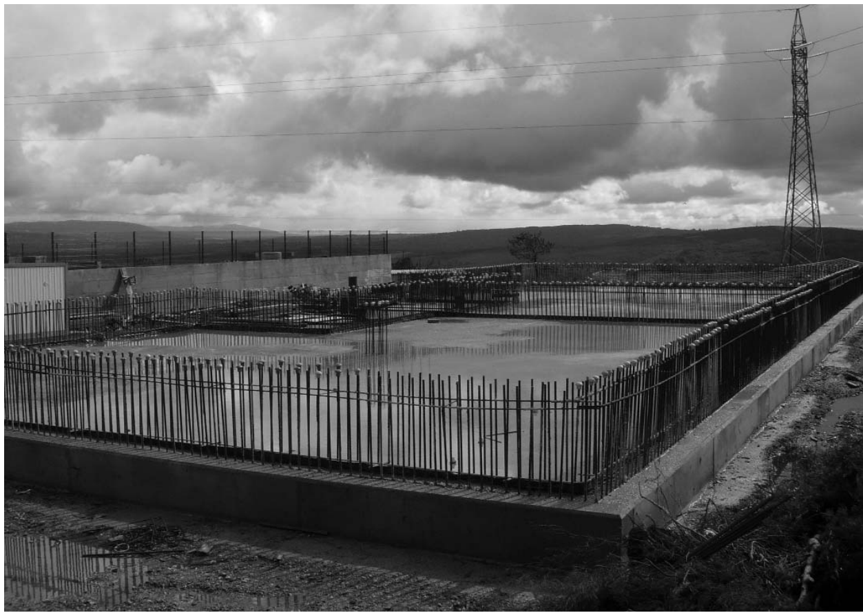
Construcción del depósito de 1500 m3 en Os Airíos

La Central Térmica ha estado funcionando al 75% de su capacidad desde el 1 de agosto de 2006