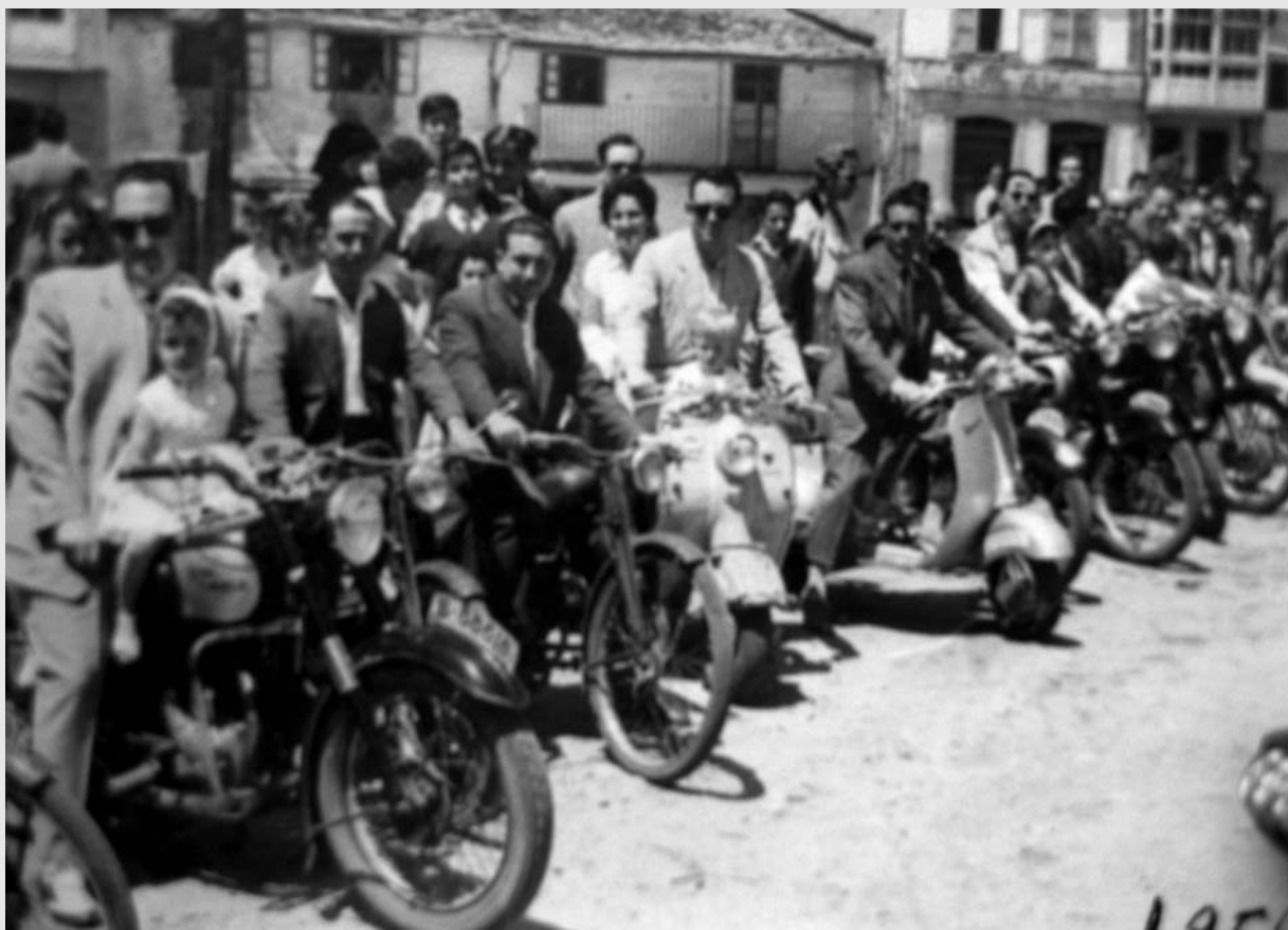
Año 1956 - Concentración de motos en la que es ahora la Plaza del Hospital.