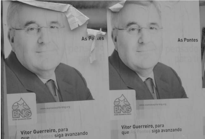
La sonrisa de un verdugo en la excedencia

No puedo negar que durante unos días tuve la tentación de seguir el humo de la nave en caída libre y continuar atacándola como desde aquella noche hacen quienes fueron sus víctimas, el Tercer Reich pontés caía para sorpresa de todos antes de lo esperado y quienes, según se anunciaba, teníamos que haber sido hace tiempo exterminados seguíamos volando alto, como siempre, mirando el horizonte, seguros, más fuertes que nunca, y sin miedo. Pero hacer leña del árbol caído no fue nunca mi forma de ser, más cuando el destino inevitable del verdugo será, sin necesidad de ayudas, el esconderse entre la penumbra de su bunker político, para, tarde o temprano, terminar como triste despojo social de sus víctimas de ayer.