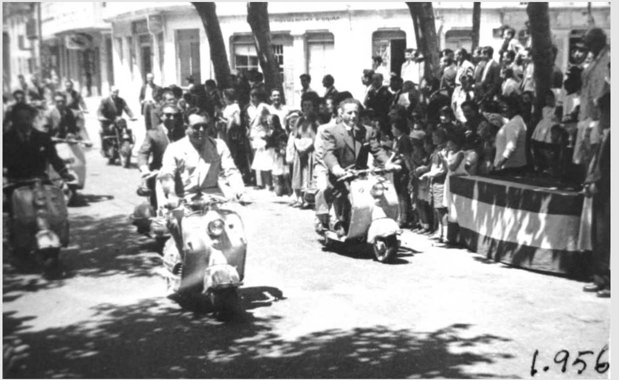
Año 1956. Exhibición de motos Vespa en la Plaza del Hospital.