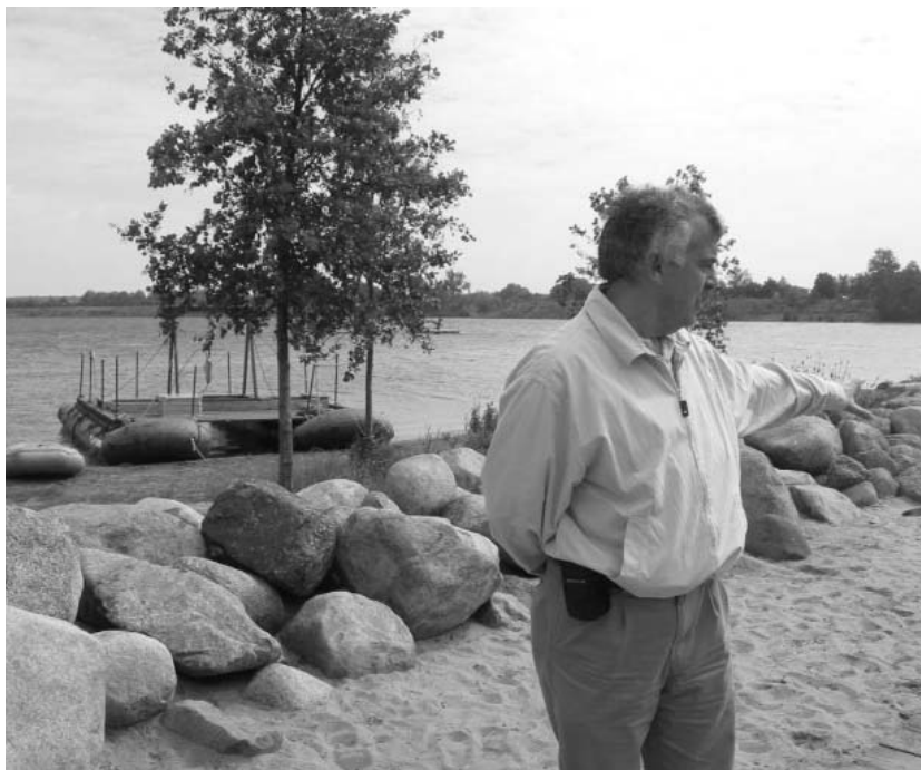
En el lago minero de Sestenberg, al norte de Alemania

Resulta también de primerísima importancia y clave para nuestro futuro, el articular y dar forma desde el Ayuntamiento y las instituciones sociales, políticas y sindicales, un conjunto de medidas administrativas y legales que permitan el control para uso industrial y urbano por parte de los vecinos de As Pontes de los casi cien millones de metros cúbicos de agua excedentes anuales previsibles de nuestro Lago de As Pontes,