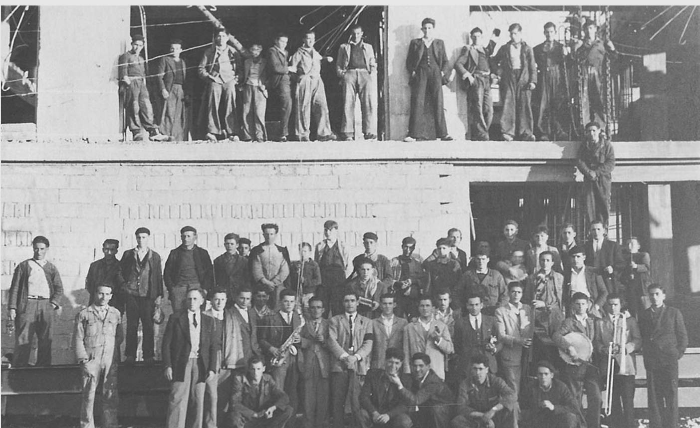
1948 - Grupo de trabajadores de la construcción de la Central Térmica de 32 Mw