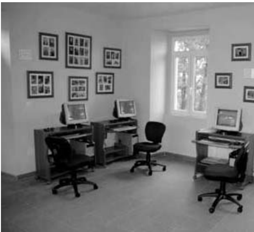
Telecentro de O Deveso

El proyecto de telecentros en As Pontes cumplió dos años el pasado mes de marzo y todavía está calando a marchas forzadas entre la población del mundo rural. Son los más jóvenes los que se adentran en el mundo de las nuevas tecnologías para actividades académicas, de ocio, o incluso, para encontrar ofertas de trabajo a través de la Red. Pero los mayores aún se resisten a sentarse frente al ordenador. Los centros que el Ministerio de Industria, la Xunta y el Concello desplegaron por once parroquias de As Pontes apenas se usan, pero le cuestan a las arcas municipales más de 5.000 euros al año. Según datos aportados por el Ayuntamiento, los más utilizados son los de Goente, Gondré y Somede, mientras que en el polo opuesto se sitúan los de Bermui, Deveso y O Freixo, donde su uso no es muy regular. Todos ellos están gestionadas por las asociaciones de vecinos, que son las que ponen a disposición de los usuarios los equipos informáticos y los centros cuando lo solicitan. Sin embargo, a pesar de los cursos que se han puesto en marcha durante estos dos años para iniciar a los más mayores en el ámbito de las nuevas tecnologías, los vecinos de algunas como Bermui o Ribadeume, por ejemplo, siguen pidiendo a alguien que realice por ellos gestiones como la petición de consultas médicas, según reconoce uno de los