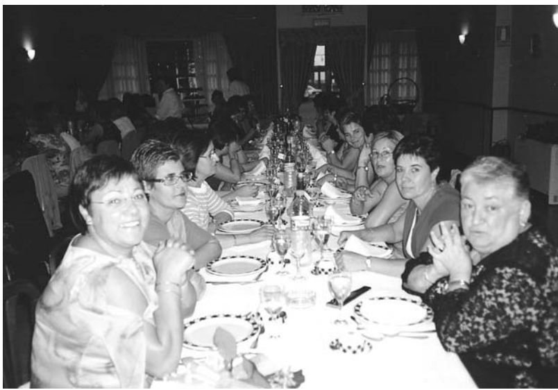
Tradicional Cea das Carmes, celebrada o pasado 15 de xullo