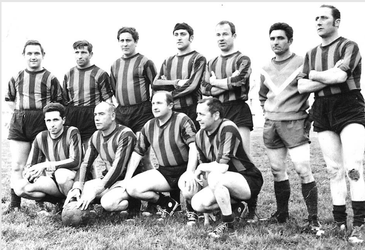
Foto de Época