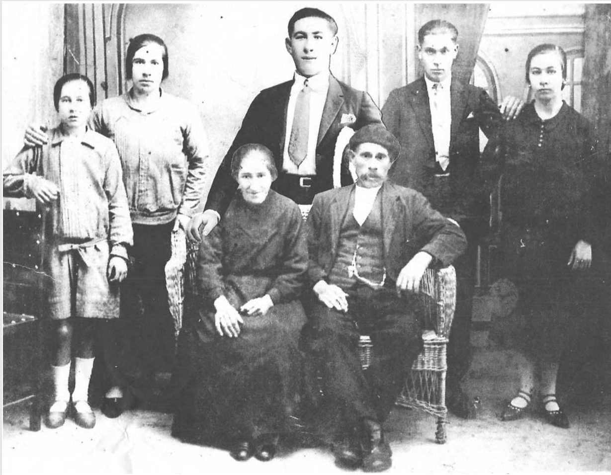
Foto de Época

Nota: En esta sección aparecen los datos inscritos en el Registro Civil de As Pontes. Por ello, a veces faltan nacimientos, matrimonios o defunciones, que, aún siendo de As Pontes, están inscritos en otros Registros Civiles. En ese caso, si lo desean, no duden en ponerse en contacto con A Nova Unión para incluirlos en esta sección.