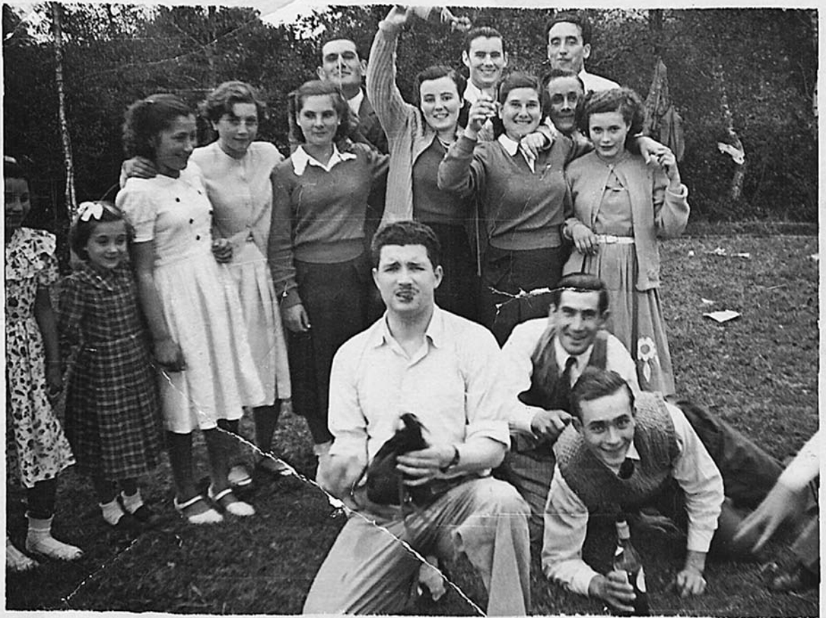
Recuerdo del Rosario de Piñeiro. 1950. Mozos del Acivido y A Mourela.